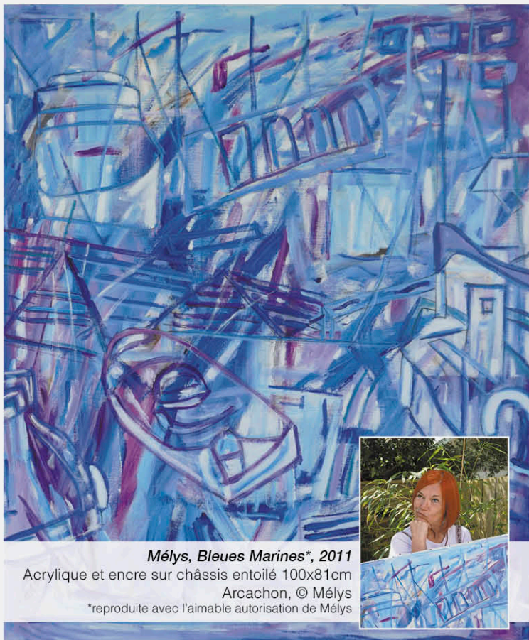
Mélys, Bleues Marines* , 2011

Acrylique et encre sur châssis entoilé 100x81cm