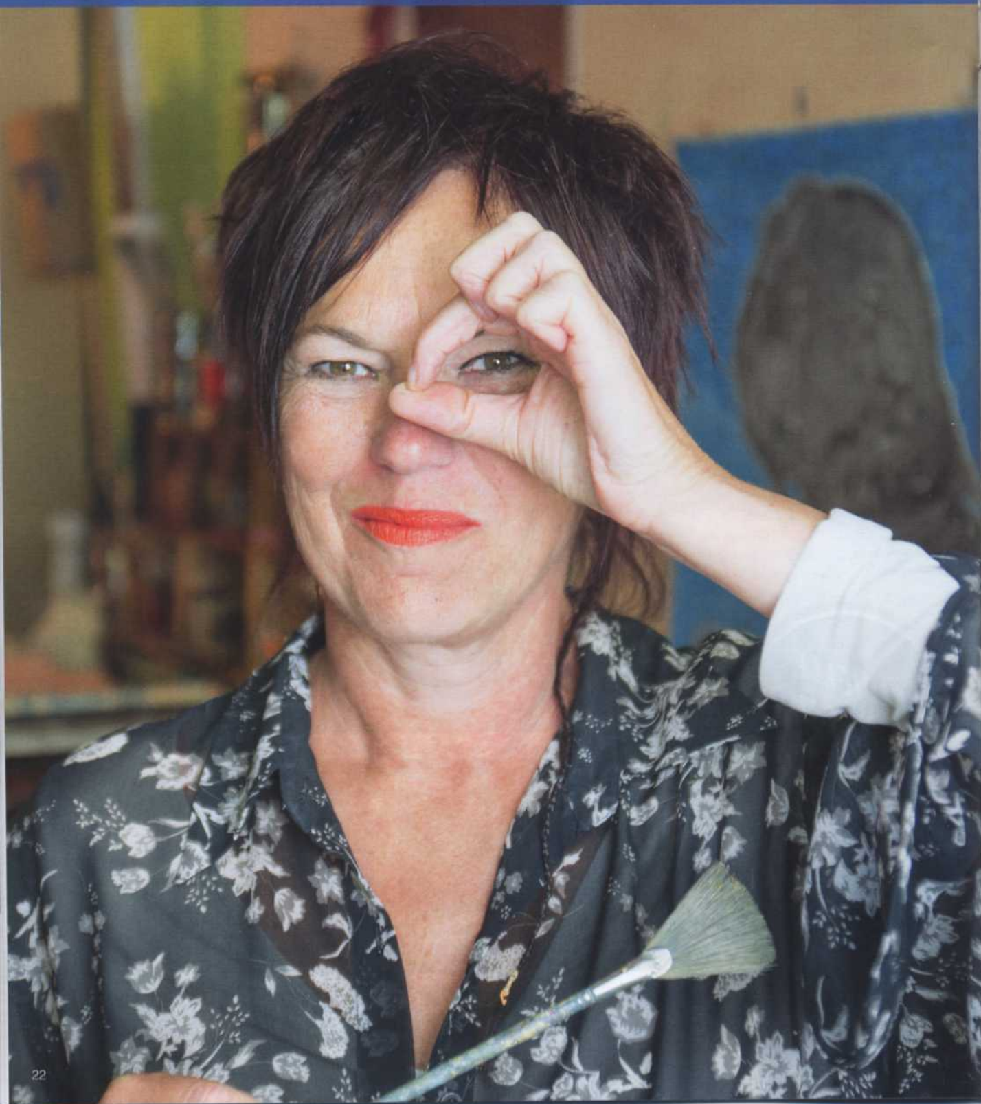
Propos recueillis par Cécile Desnouhes