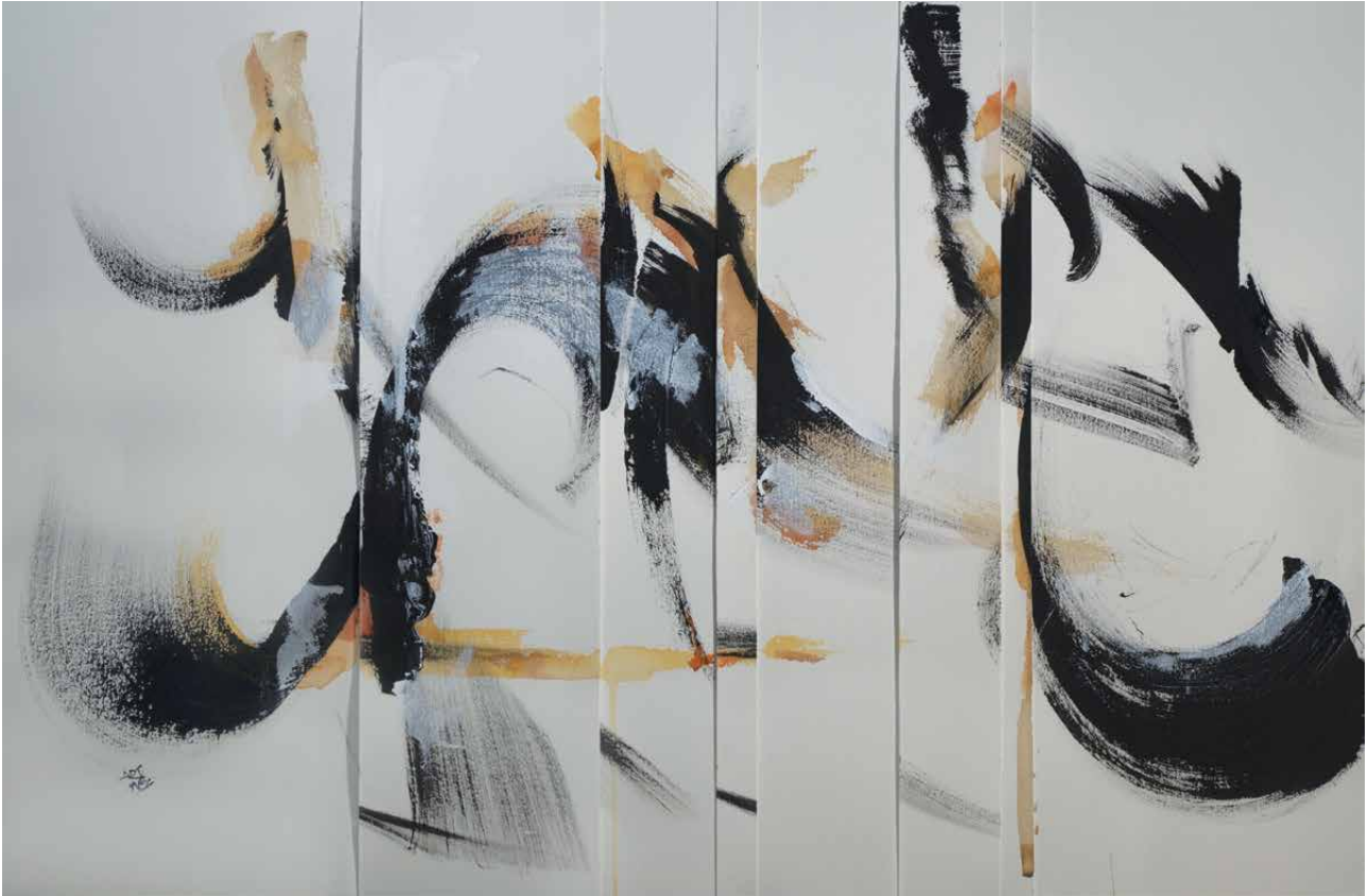
© Collage GD6 - Technique collage, acrylique et aquarelle sur papier 100% coton italien 100 x 70 cm - Art.no