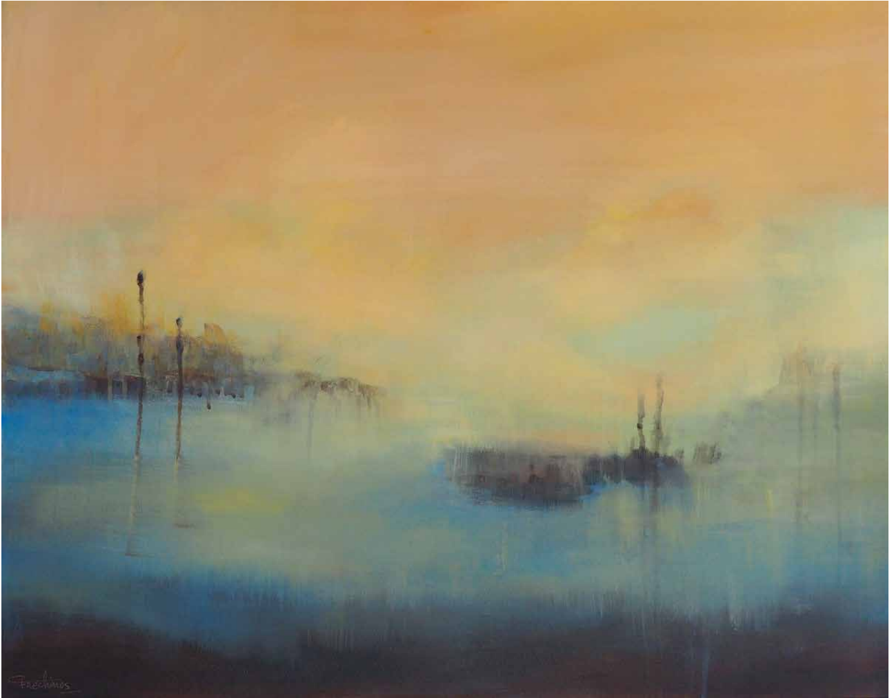
© Archipels 2 - Acrylique 73 x 92 cm - Caroline FRECHINOS