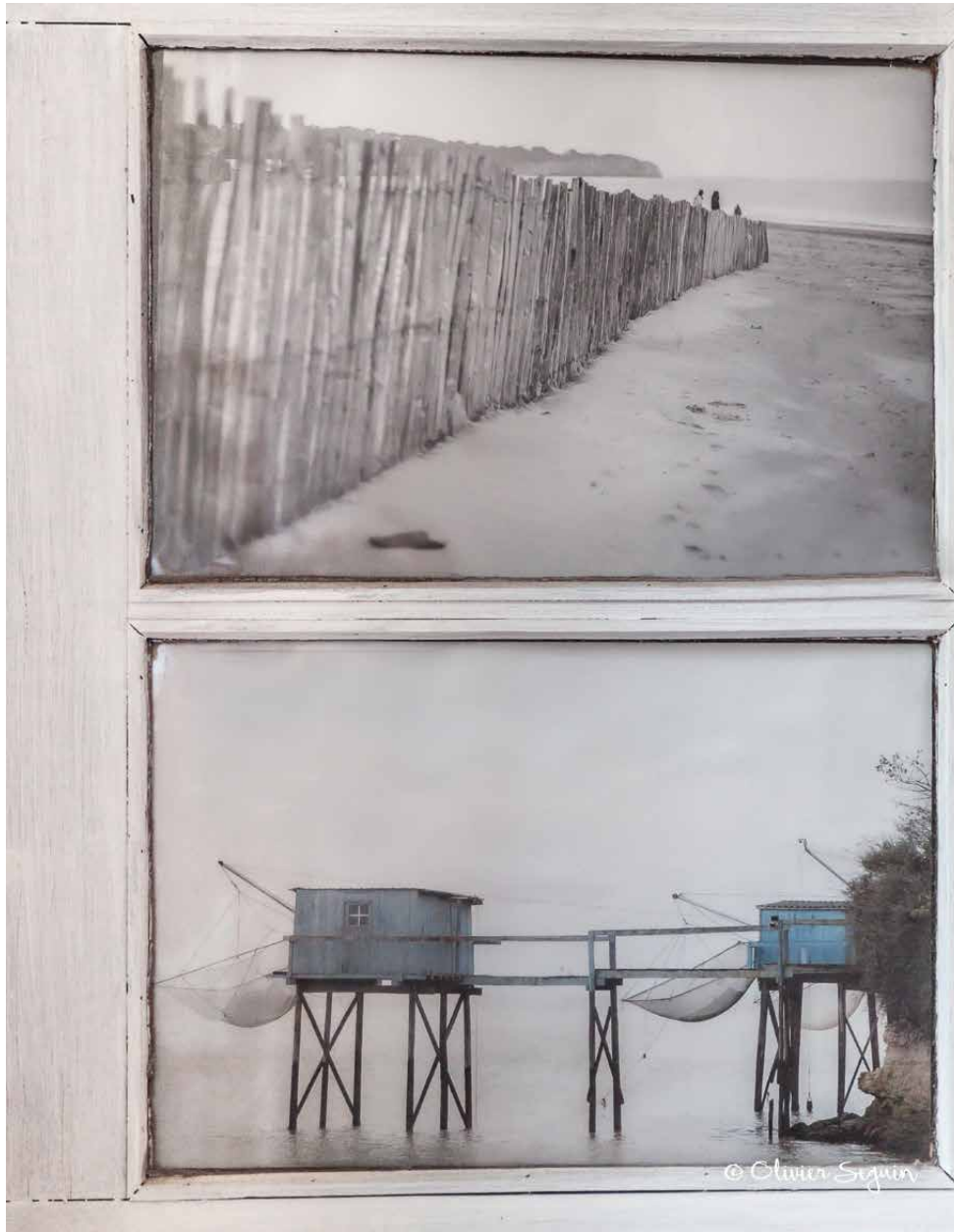
© Extrait de l'œuvre intitulée « Rives » - Olivier SEGUIN