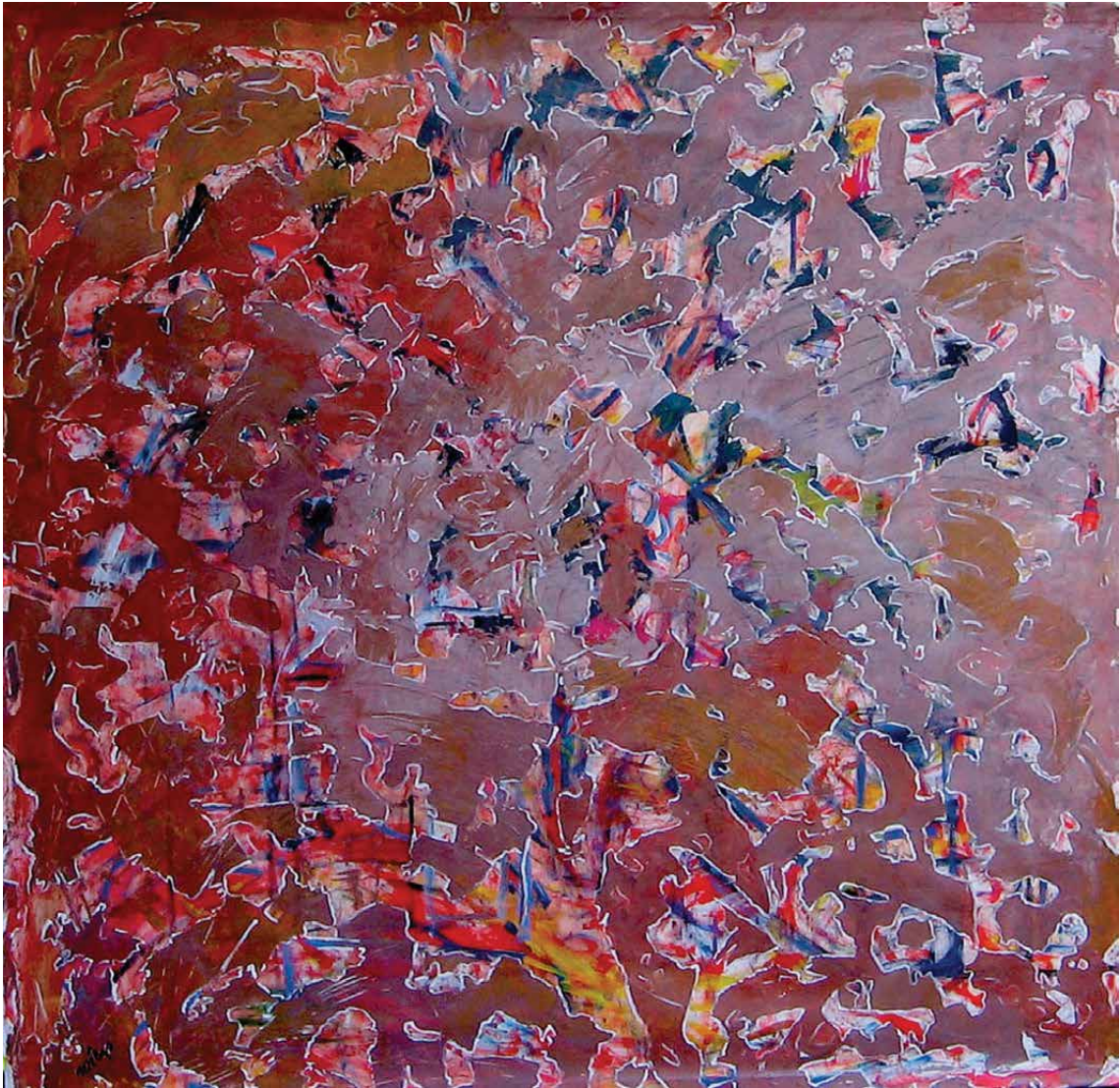
© « Nos Fragments », acrylique, encre et pigments sur toile 160 x 160 cm - MÉLYS