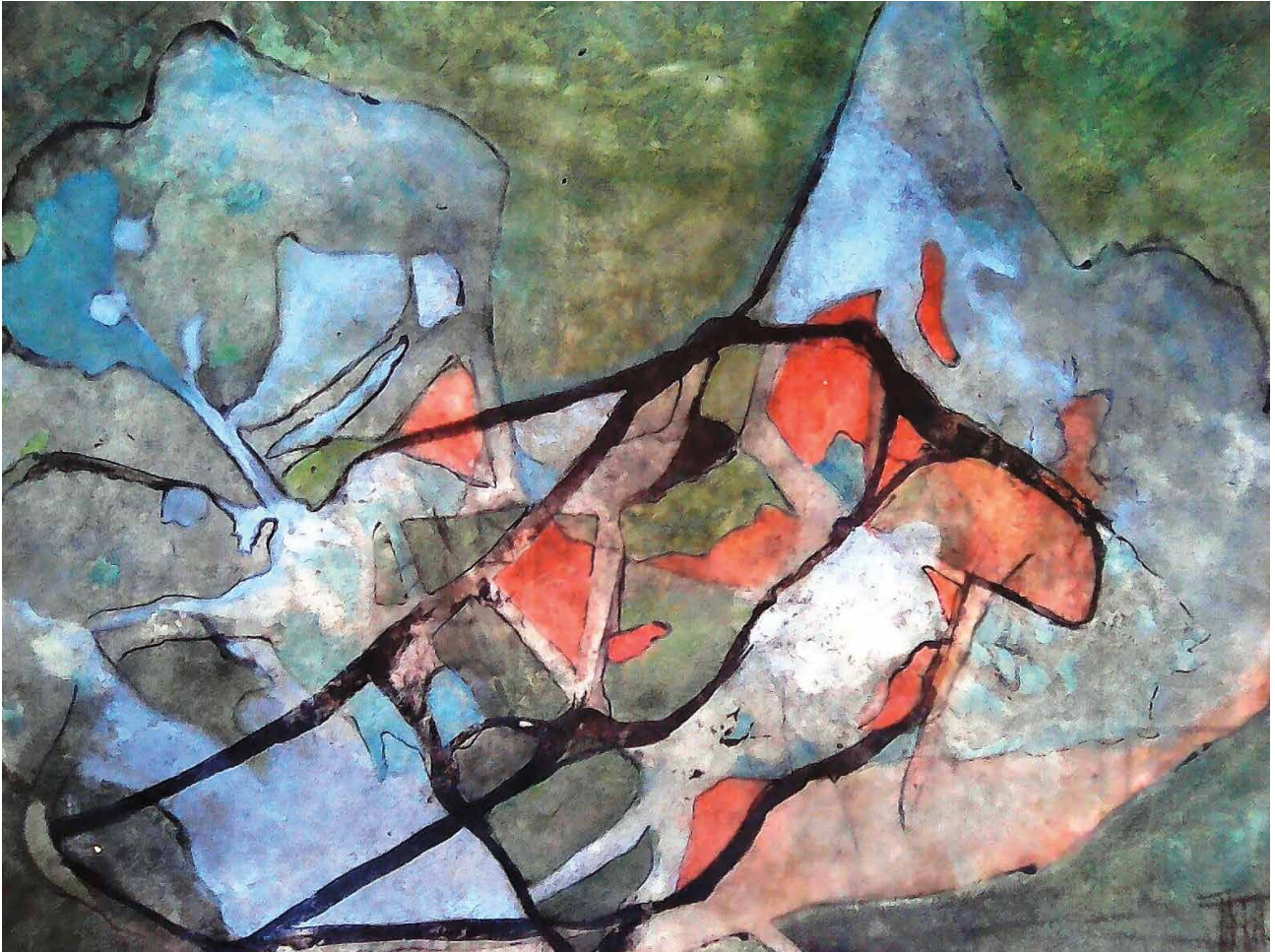
© « Par-chemins » Peinture sur verre 73 x 92 cm - Isabelle THERET